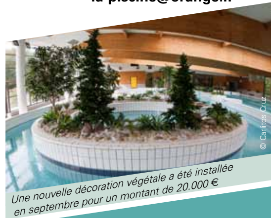
Une nouvelle décoration végétale a été installée en septembre pour un montant de 20.000 €

Pour sans cesse améliorer nos prestations nous avons installé une boîte à suggestions à l'entrée du centre nautique. N'hésitez pas à nous faire part de vos remarques lors de votre visite ou envoyez-nous un mail à la-piscine@orange.fr