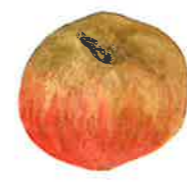
Belle de Boskoop