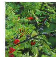
Sorbier des oiseaux