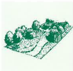
UN JARDIN COMPOSÉ DANS UN STYLE NATUREL ET AÉRÉ, ADAPTÉ À LA VILLE COMME À LA CAMPAGNE.