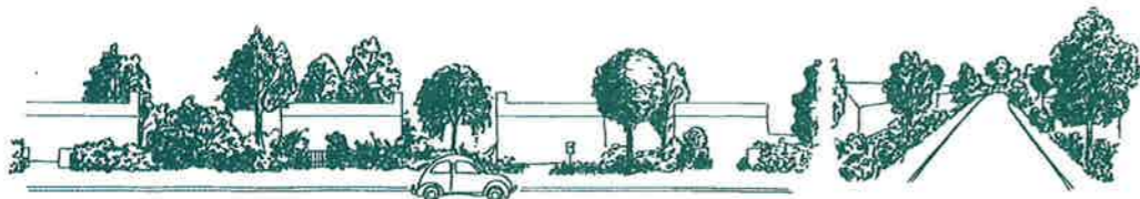
UN AMÉNAGEMENT PAYSAGER AVEC PLUS DE SOUPLASSE VÉGÉTALE

La "haie mixte libre" ou "haie-jardin" se différencie de la "haie-écran" par sa fonction principale, qui n'est pas de s'isoler du regard extérieur, mais de créer un décor et une