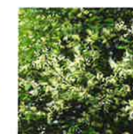
Cerisier à grappes