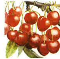
Griotte de Montmorancy