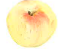
Transparente de Croncos