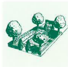
UN JARDIN STRUCTURÉ, ET ORDONNÉ, PLUTÔT ADAPTÉ À LA VILLE.