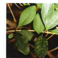
Chèvrefeuille des bois