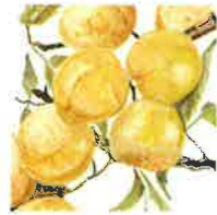
Mirabelle de Nancy