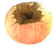
Reinette dorée de Blenheim