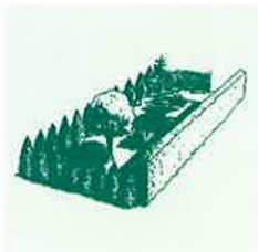
UN JARDIN MAL COMPOSÉ, DIFFICILE À VIVRE : UNE SUR-RENCHÈRE DE VÉGÉTAUX QUI BLOQUE L'ESPACE VITAL.

Composer son jardin, c'est associer les végétaux pour obtenir un effet. Voici trois jardins, trois ambiances, trois prix sensiblement similaires ; ce qui les différencie, c'est leur conception.