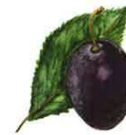
Quetsche de Bühl