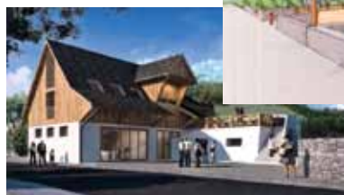
Projet de rénovation de La Grange à Hohrod