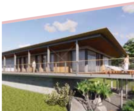
Vue de l'extension de l'espace bien-être avec sa terrasse donnant sur le parc verdoyant de La Piscine

Ces travaux d'envergure devraient être menés sans fermeture totale de l'équipement. Les animations et cours scolaires en bassins seront assurés normalement.