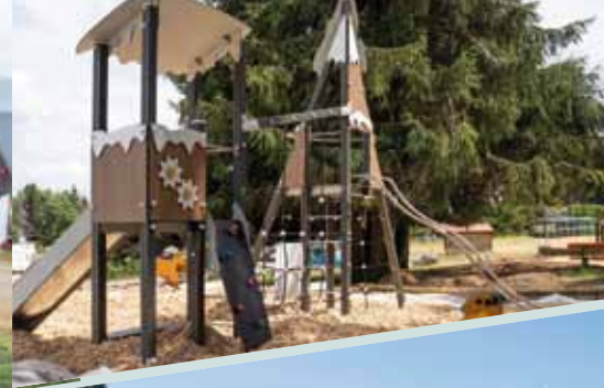
Les aires de jeux du Gaschney et du Schnepfenried, parfaitement intégrées dans le paysage de montagne