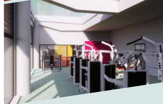
L'espace remise en forme entièrement indépendant proposera un espace plus convivial doté de plus de machines et des sanitaires dédiés