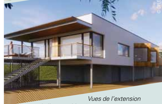
Vues de l'extension de l'espace bien-être avec sa terrasse donnant sur le parc verdoyant de La Piscine